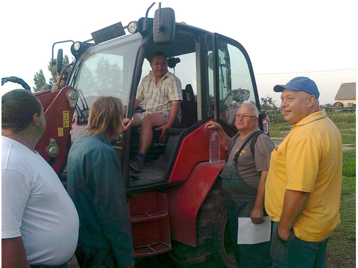
A rakodógép „birtokba vétele”

Gazdaságunk, a Pusztaszabolcsi Agrár Zrt. a „helyi adottságokhoz, erőforrásokhoz illeszkedő térségi gazdaságfejlesztés” keretében a „Helyi vállalkozások fejlesztése, új szolgáltatási paletták kialakítása, versenyképességük növelése” célterület keretében 10 000 000,- Ft támogatásból megvalósította a pályázati elképzelését. 2012. augusztus 06-án forgalomba helyezte SCHÄFFER 9330 T TL rakodógépet.