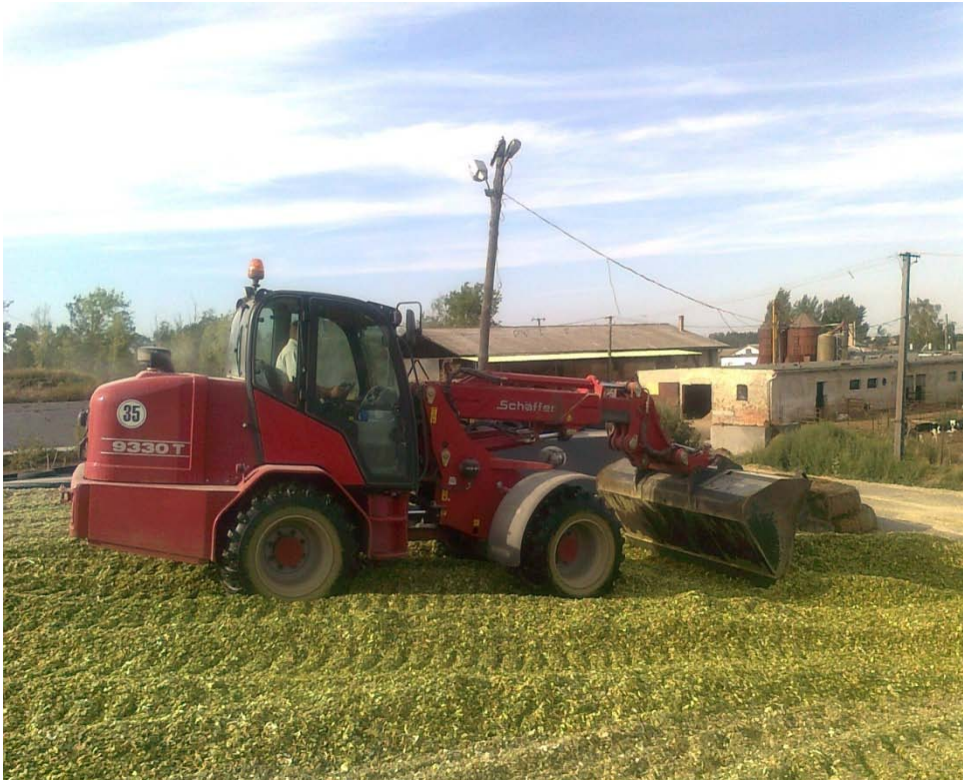
A siló egyengetése taposáshoz

A szenázsnak betakarított szálastakarmányt illetve a silókukoricát a rakodógéppel terítjük el egyenletesen a depóban, hogy a tömörítést megfelelően lehessen elvégezni.