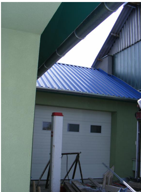
A meglévő műhelyépület hozzáépítésével megvalósult bővítés

A megvalósított beruházás építési engedélyhez kötött kivitelezéssel történt. A használatbavételi engedélyt 2014 májusában kapta meg a cég, így most már a használatba vett új műhelyépületben is folynak a gépjárműjavító munkák.