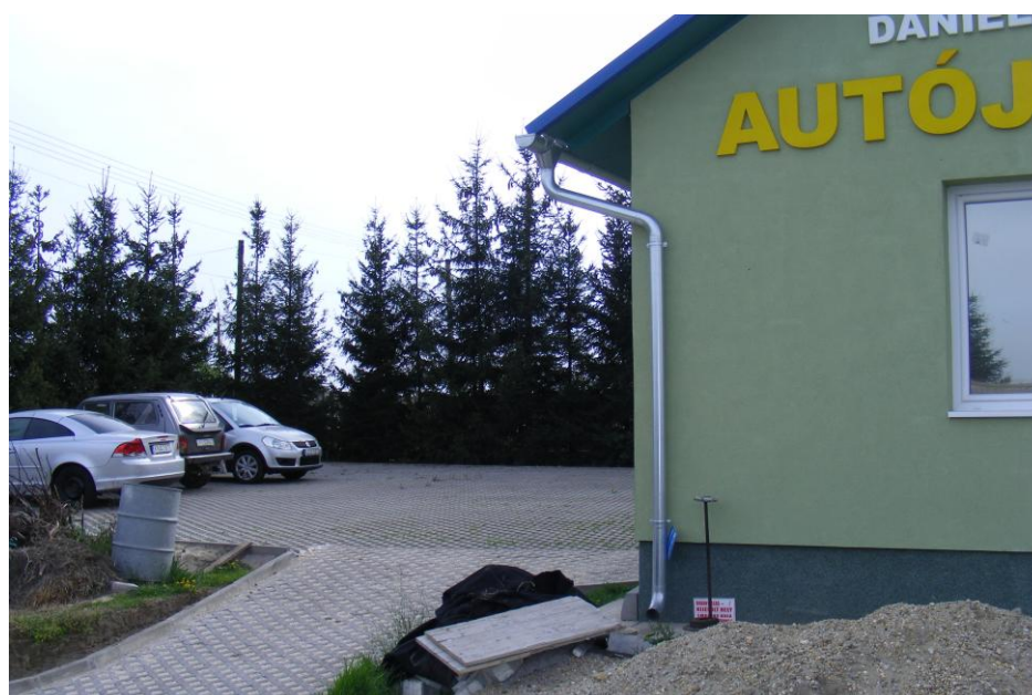
Parkoló kialakításával a javításra váró gépjárműveket kint is lehet tárolni

Európai Mezőgazdasági Vidékfejlesztési Alap: a vidéki területekbe beruházó Európa