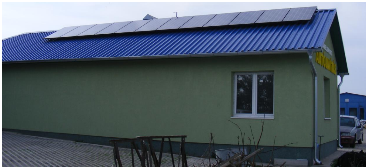
A beruházás megújuló energia hasznosítására: napelem-rendszer építésére is irányult