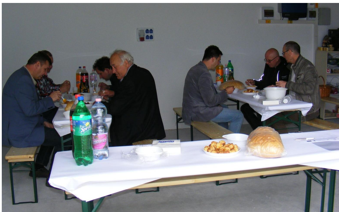
Projektet bemutató nyílt nap zárása egy ebéddel

A pályázat keretében megvalósult beruházás bemutatása érdekében a vállalkozás nyílt napot szervezett, ahol minden érdeklődő számára egy program keretében tette lehetővé a projekt megismerését. A 2014. április 14-én megrendezésre kerülő nyílt napon a cég partnerei közül 18 fő vett részt, akik egy jó ebéd keretében beszélgettek a sikeres pályázatról.