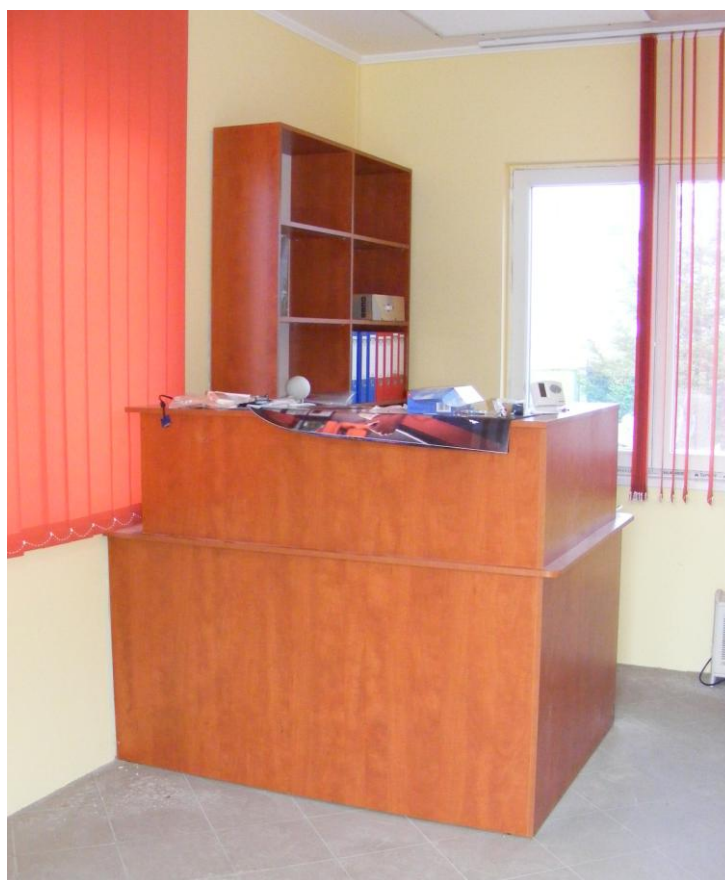
Az új műhelyépületben egy új iroda is kialakításra került

Európai Mezőgazdasági Vidékfejlesztési Alap: a vidéki területekbe beruházó Európa