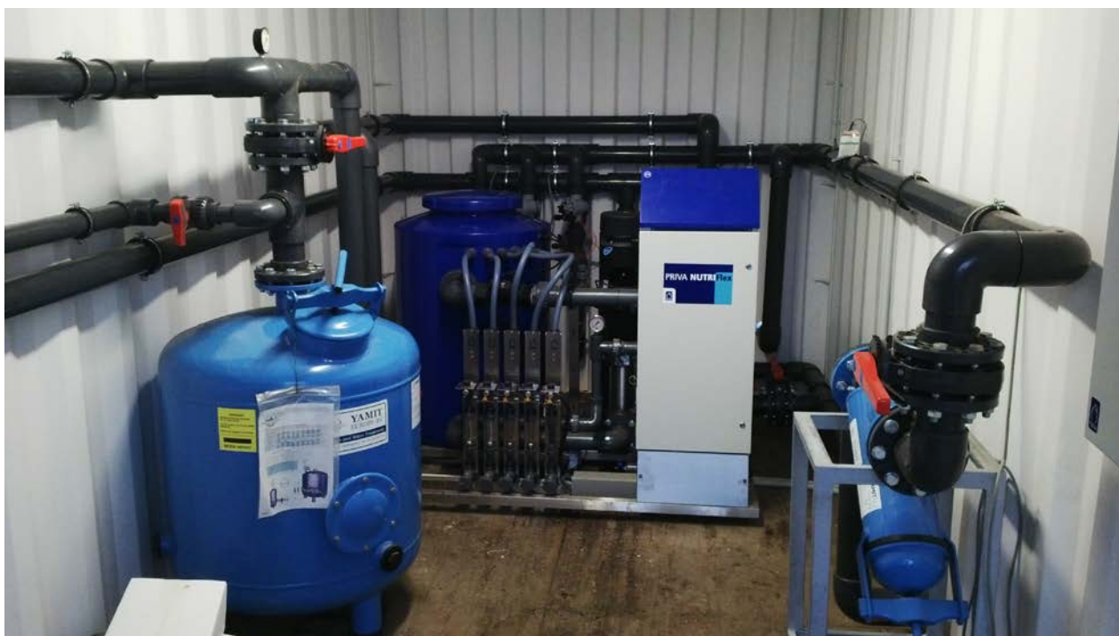
Tápladozó rendszer és vezérlő gépház