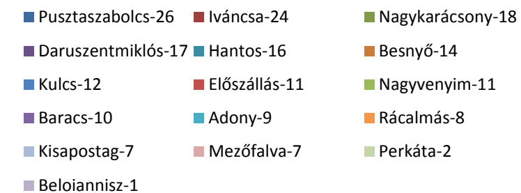
Az Egyesülethez beérkezett 193 Projektötlet adatlap helyszín szerinti megoszlása